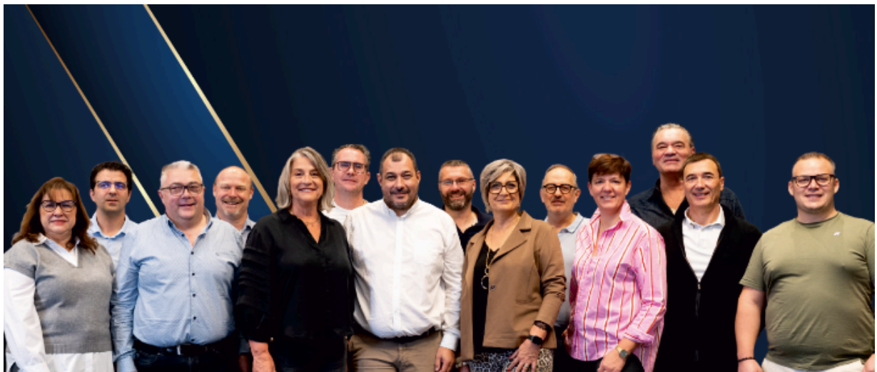
Nouveau Bureau élu pour 2 ans

« J'insiste sur le fait que notre nouvelle équipe est avant tout au service du réseau et de ses adhérents. Nous sommes tous incontournables ! »